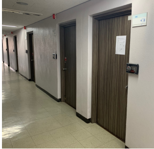
그림 2. 입력 이미지

본 논문의 제안된 벽 모서리 추출 방법을 실험하기 위해 실제 건물에서 촬영한 이미지를 입력 이미지로 사용하여 실험하였다. 그림 2 는 실험에 사용된 입력 이미지이다.