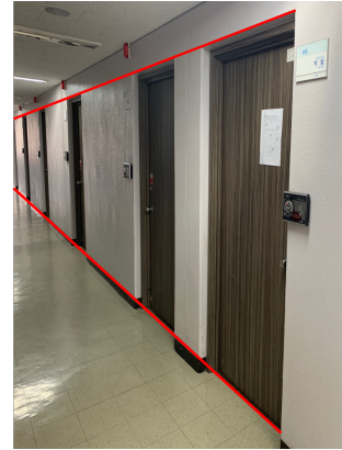
그림 4. 벽의 모서리 검출 결과

그림 4 는 문의 벽과 평행한 모서리들을 확장한 그림으로 확장한 모서리가 벽의 모서리와 일치하는 것을 볼 수 있다.